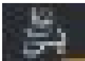
surat yasin arab

Ingin aplikasi Surat yasin di smartphone tanpa install? klik ikon 3 titik (sebelah kanan atas) di browser Chrome kemudian pilih “Tambahkan ke layar utama”. Selanjutnya klik aplikasi surat yasin dari layar utama smartphone Anda.